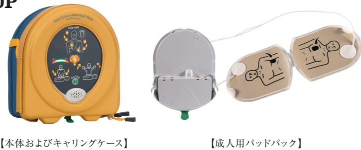
【本体およびキャリングケース】